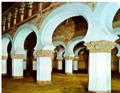
בית הכנסת העתיק בטולדו, הוקם בשנת 1200 בערך ושימש כבית כנסת עד שהפך לכנסייה בשנת 1405.

15:15-17:00 פתוח-סגור-פתוח – זהות מתגבשת מתוך מפגש או התנגשות עם ה"אחרים" שלה. במהלך הסדנא נעסוק בתהליכי עיצובה של זהות אישית ומשותפת, ונבחן כיצד משרתות מגמות של פתיחות והסתגרות את תהליך בנייתה של הזהות. נשאל בין היתר, עד כמה חשים המשתתפים כי המפגש עם תרבויות אחרות הוא מעשיר ומפרה, ובאילו מובנים הוא עשוי לאיים ולערער את תחושת הביטחון שיש להם בזהותם.